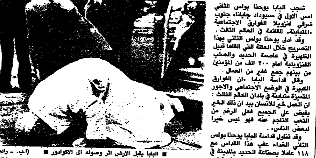
البابا يعبر الأرض اثر وصوله الى الكوادور

شجب البابا يوحنا بولس الثاني أمس الأول في سيوداد جيلينا جنوب شرقي فنزويلا الفوارق الاجتماعية، والتمييز، القسوة في العلم الثالث. وقد أدلى يوحنا بولس الثاني بهذا التصريح خلال العظة التي ألقاها قبل رجعة فيب، بسحب كل الأسلحة النووية الكفوقية عام ٢٠٠٠ لك من المؤمنين من بينهم جمع غفير من العمال. وقال قداسة البابا «إن الفوارق الكبيرة في الوضع الاجتماعي والأجور اجتماعا مفردا اليوم الخميس قبل أن يبدأ المؤتمر لبحث امكانيات السلام في أمريكا الوسطى وهي إحدى المناطق المستهدفة في العالم». كما يحضر مؤتمر اثينا الشلاني القديسي الأمين العام لجامعة الدول العربية وكارلوس أندريس بيرث رئيس فنزويلا السابق ورئيس الدولة الاشتراكية بالإضافة إلى رؤساء الوزراء السابقين أدغار فور ومرشاه هولدوا.